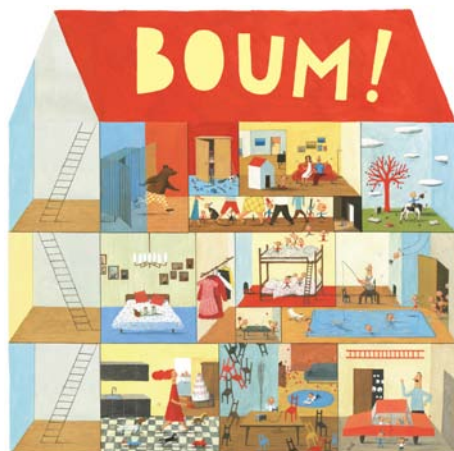
Plateau de jeu Boum ! par Frédérique Bertrand, impression sur bois, 120 x 120 cm.

Avec Frédérique Bertrand (autrice-illustratrice)