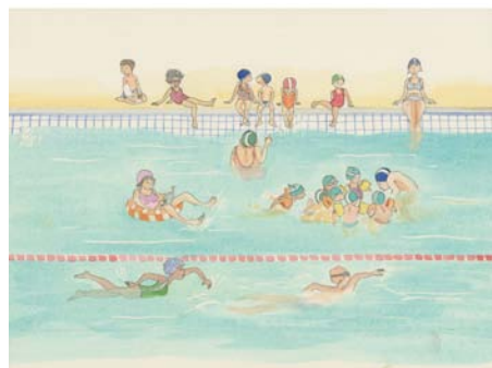
Extraits du livre Se Jeter à l'eau de Geneviève Casterman à retrouver dans ses trois jeux.