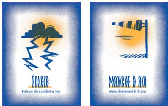
Cartes du jeu Tous aux abris de Renaud Perrin, illustrations réalisées en gravure.