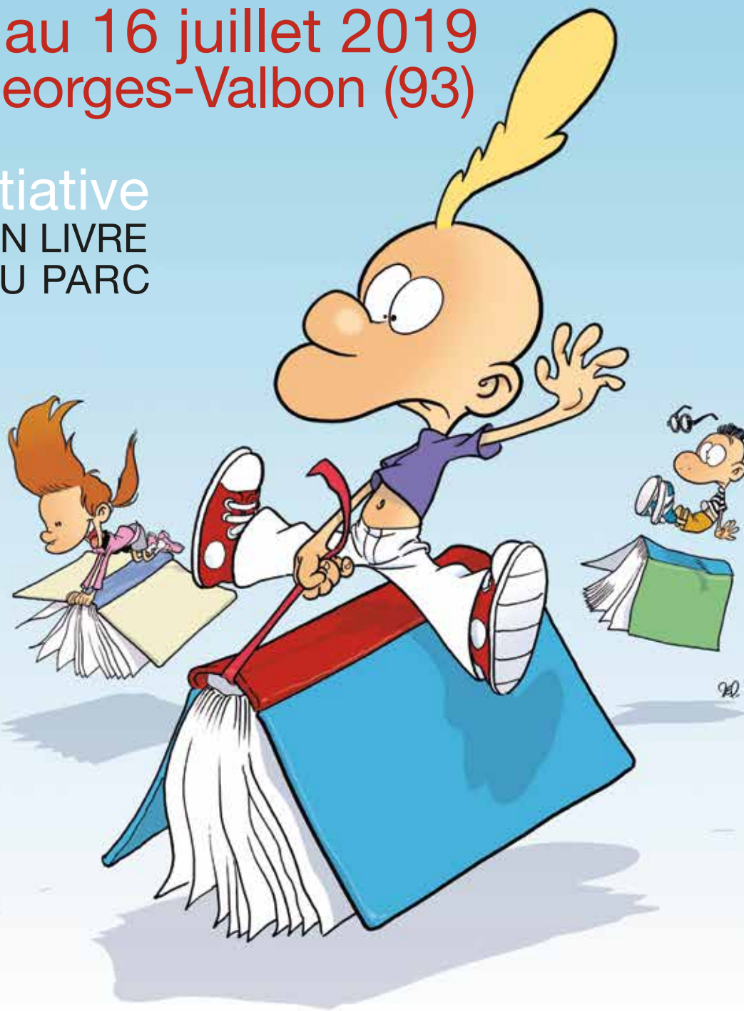
Illustration: Zep pour Partir en livre

une initiative PARTIR EN LIVRE & LIRE AU PARC